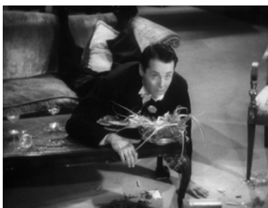
Abb. 11: THE LADY EVE , Demütigungen als Lektionen

Der »release from the circle of vengeance« (ebd., 109), die Überwindung des Misstrauens und einer falschen Form von Identifizierung des Gegenübers, wie sie das (falsche) romantische Bewusstsein durch die Konzentration auf ein Ideal des Anderen verursacht, wird durch die Komik ermöglicht. Komik ist weder Ersatz noch Kompensation, sondern Teil eines Prozesses der Transformation. Henry Fonda wird nicht nur lächerlich gemacht, stolpert in jede Slapstickfalle, die sich ihm im Film in den Weg stellt, damit die Betrachter über ihn lachen können, sondern er muss auf schmerzhaft Weise die Kluft zwischen Ideal und Realität akzeptieren lernen. Dieser Zusammenhang trägt dazu bei, die Komik als elementaren, als ›inneren‹ Bestandteil des Films zu betrachten, als Teil seines philosophischen Arguments. Und anders als die Aufhebung, die Bachtin mit dem Festlichen und Komischen als durch Ritualisierungen konstituierte andere Räume unseres Daseins beschreibt, ist der Raum des Films, der diese Übergänge erlaubt, kein eindeutig von der Wirklichkeit unterschiedener Raum, sondern ein Raum, den wir uns im Alltag selbst immer wieder erobern können und müssen.