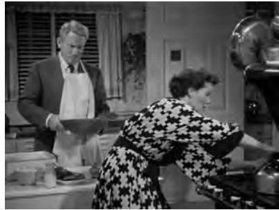
Abb. 12: ADAM'S RIB, Das Öffentliche und Private

nicht über die Figuren, sondern mit ihnen lacht, weil man an ihren Entwicklungen und Erschütterungen interessiert ist und daher der Erzählung folgt. Denn beide Figuren, sowohl Adam als auch Amanda Bonner, brauchen die verletzenden Momente, sie brauchen die ständige Möglichkeit der Scheidung, um ihre Beziehung erneuern zu können. Cavell bezeichnet ADAM'S RIB als den häuslichsten der sieben Filme, der uns nicht nur auf sehr intime Weise den Alltag einer zunächst harmonischen Ehe vorführt, sondern auch die Gefahr des Narzissmus, die in dieser Häuslichkeit droht (ebd., 191). Amanda will dieser Gefahr mit einem pädagogischen Akt begegnen, der weder allein die Demütigung ihres Mannes noch den Beweis der Gleichrangigkeit der Geschlechter im Sinn hat: Amanda fordert ihre Anerkennung durch seine Anerkennung der Öffentlichkeit ihrer Beziehung (ebd., 199) – nicht nur vor Gericht, sondern auch vor den Zuschauern des Films.