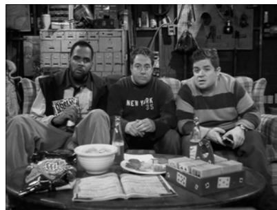
Abb. 28: KING OF QUEENS, Danny, Spence und Deacon werden zu Betrachtern

Diese Auseinandersetzung mit einem transgressiven Alltag setzt sich in KING OF QUEENS in der Beschäftigung mit seinen Figuren als Zuschauer fort. Vor allem die Episode LIFE SENTENCE (Episode 83, DIE REALITY SHOW), in der Arthur ohne sein Wissen wegen seiner Herzprobleme von einer Kamera überwacht wird, gibt auf spielerische Weise mehrere Vorstellungen vom Zuschauer wieder, die Diskurse und Theorien entwerfen und die hier parodiert werden. Sie führt vor, dass Fernsehen als Überwachungsmedium zu verstehen ist, dass die Zuschauer sich von der einfachen Wiederholung von Alltag berühren lassen. Und wenn sich Spooners Leben durch den Streit mit Doug und Carrie in eine Soap-Opera verwandelt, die die Kargheit des Formats in seiner Frühform thematisiert (wir sehen dieses Melodrama im archaischen Schwarzweiß der Über-