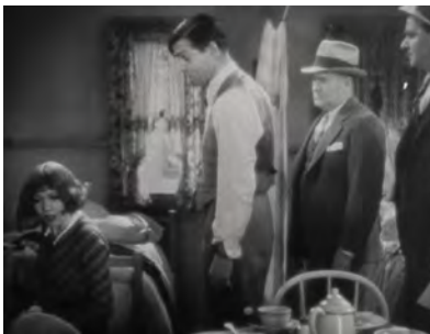
Abb.4 und 5: IT HAPPENED ONE NIGHT , Unterhaltung und Spiel

Bereits in IT HAPPENED ONE NIGHT der ersten Komödie der Wiederverheiratung, findet sich eine Szene, in der Clark Gable und Claudette Colbert sich in einem Motel so verhalten müssen, als ob sie ein einfaches, zankendes Ehepaar wären. Sie tun dies mit einem so großen Können (niemand weiß, woher die Millionärstochter weiß, wie einfache Amerikaner miteinander umgehen und sprechen) und mit einer so großen Freude, dass in den Hintergrund tritt, warum sie dazu gezwungen sind, etwas vorzuspielen. Diese Sze-