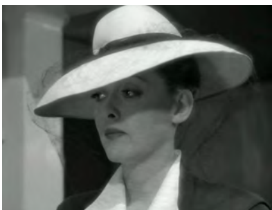
Abb. 17: NOW, VOYAGER, Metamorphose

ge zunächst aus, beantwortet sie dann aber mit folgenden Worten: »I am the fat lady with the heavy eyebrows and all the hair«.