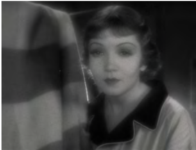
Abb. 13 und 14: IT HAPPENED ONE NIGHT, Die Realität der Imagination

mit soft focus gedrehte Einstellung mit einer in hard focus gedrehten Einstellung kontrastiert. Damit wird jeweils ein unterschiedlicher Status von Film angedeutet: Die weiche und die ›normale‹ Linse stellen in ähnlicher Weise eine Bedingung der Wahrnehmung dar wie es die kantischen Anschauungsformen tun (Cavell 1981a, 99). Der Reporter erzählt im Bett des Motelzimmers, in dem die beiden Hauptfiguren getrennt durch die als Grenze aufgerichtete Bettdecke liegen, von seinem Traum vom Leben und von einer Frau, die wirklich ist: »Somebody that's real, somebody that's alive. They don't come that way anymore«. Ellie verliert die Kontrolle über die Begrenzung, überwindet die Barriere und dringt in seinen Traum ein, um ihm zu sagen, dass sie diese Frau sein könnte. In diesem kurzen Moment, für eine Sekunde, erscheint ihr Gesicht im Objektiv einer weichen Linse. Sie bricht als wirklicher Mensch in seinen Traum ein: Was die Szene zeigt, ist, dass es einen Unterschied und eine Barriere gibt, aber wo die Grenze ist, wird nicht deutlich. Es stellt sich die Frage, ob Gable einen Traum sieht, oder ob die Zuschauer eine Illusion