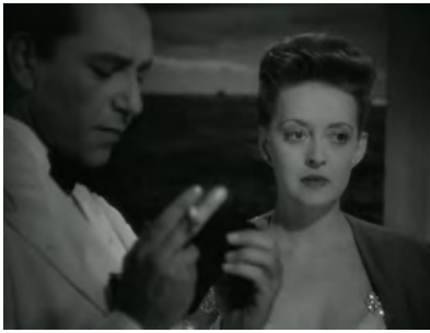
Abb. 16: NOW, VOYAGER, I am the fat lady with all the hair

Frau spielt und plötzlich ohne Übergang als Bette Davis präsentiert wird, symbolisiert eine Wandlungsfähigkeit, die Filme auf glaubwürdige Weise vermitteln können. Die Zuschauer sehen keine Entwicklung, fast nichts bereitet sie auf den Anblick vor, als sich Bette Davis zum ersten Mal auf dem Schiff zeigt. Wir wissen, wie die junge, attraktive, selbstbewusste Charlotte Vale ausgesehen hat, weil sie uns in einer Rückblende auf ihrer ersten Schiffsreise gezeigt wurde, auf der ihr frühes Glück mit einem jungen Schiffsoffizier von ihrer Mutter auf nachhaltige Weise zerstört wurde. Nach den ersten Szenen des Films, die uns die zutiefst verunsicherte, ungepflegte und zurückgezogene Charlotte Vale zeigen, sehen wir sie nur einmal während ihrer Therapie im Sanatorium. Sie hat sich nicht nennenswert verändert, steht aber kurz davor, den Aufenthalt zu beenden, um sich mit den geborgten, eleganten Kostümen einer Verwand-