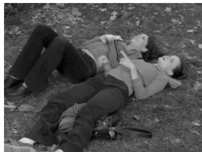
Abb. 25: GILMORE GIRLS, Freundinnen