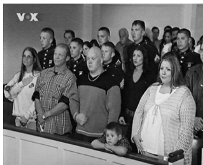
Abb. 31 und Abb. 32: 7TH HEAVEN, Die wirkliche und die imaginäre Familie

Familie einen eigenartigen ästhetischen Reiz, der mit folgendem Antagonismus zusammenhängt: Der Serie geht es, trotz aller Versuche der affirmativen Anschlüsse an eine politische Ordnung, gleichzeitig um die Abschließung und Sicherung des Ortes der Familie und des Zuhauses. Das Fernsehen überträgt durch seine Präferenz für die von Konsum bestimmte und damit fernsehökonomisch interessante Vorstadt die Angst auf das, was aus der Vorstadtwelt ausgeschlossen werden soll. Der gefährliche Außenraum der Wirklichkeit ist häufig ein von Kriminalität bedrohter Außenraum. David Morley geht in seiner Studie »Home Territories«, die diese Versuche der Abschottung des Zuhauses durch das Fernsehen auch als ein ästhetisches Prinzip des Mediums vorführt, so weit, die Vorstadt als eine Erfindung des Fernsehens zu bezeichnen. Das Zuhause und die Vorstadt sind also wie alle anderen Räume diskursiv bestimmte Räume, mit denen Grenzen definiert und gesichert werden sollen (Morley 2000, 128f). Das Fernsehen setzt einen Mechanismus des Einschließens und Ausschließens