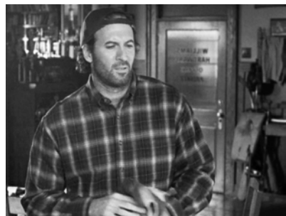
Abb. 26: GILMORE GIRLS, Lukes Erkenntnis

Diese Annäherung wird äußerst sorgfältig inszeniert. Die Serie hat bis zu dem Ende der vierten Staffel immer wieder kleine, besondere Momente inszeniert, die auf sehr beiläufige Weise die Gefühle zwischen Luke und Lorelai angedeutet haben: ein Blick, der etwas länger auf dem anderen ruhte, ein kurzes Aufflackern grundloser Eifersucht, Momente, in denen sie sich an ihrer bloßen Gegenwart erfreuen konnten. Lukes finale Erkenntnis, dass er Lorelai liebt, gewinnt er zwar mit Hilfe eines unglaublich banalen Beziehungsratgebers, aber der Ratgeber gibt ihm die Möglichkeit, alle diese kleinen magischen Momente zu rekapitulieren: Er hört sich den Beziehungsratgeber auf Cassette an, der diverse Fragen danach stellt, mit welcher Frau er Spaß hat, an welche Frau er am häufigsten denken muss und Ähnliches. Luke beantwortet diese Fragen nicht hörbar. Wir sehen nur sein Gesicht,