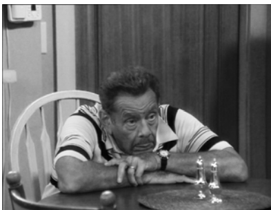
Abb. 27: KING OF QUEENS, Transfiguration

In dieser Folge findet sich eine Einstellung, die zugleich sehr einfach und sehr wirkungsvoll die Möglichkeit der Transfiguration von Menschen in Film und anderen Medien vorführt. Spooner sitzt in der Küche, stützt in sehnsüchtiger Erwartung den Kopf wie ein gelangweilter, trau-