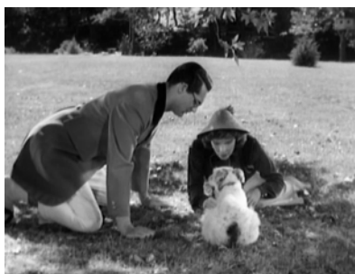
Abb. 3: BRINGING UP BABY, Rückkehr in die Kindheit

Shusterman gibt einen Hang zum Schematismus der Argumentation durch die intensive Konzentration auf negative Bezugspunkte wie Adorno wieder, gegen den diese Aneignung eines neuen Feldes des Denkens geleistet wird. Das Interessante an Cavell ist, dass er sich auf dieses Argumentieren gegen die Kritik an der Populärkultur nicht wirklich einlässt. Es gibt keinen ›Dancefloor‹, den er noch zu entdecken hätte. Er kennt die Filme, über die er sprechen will, zu lange, als dass er noch von der plötzlichen Erkenntnis überfallen werden könnte, dass es etwas gibt, das seine Theorie bisher noch nicht zu behandeln verstand. Und was noch wichtiger ist: Er schert aus einem Rechtfertigungszusammenhang aus und fängt einfach an zu sprechen. Bereits auf der ersten Seite weist er darauf hin, dass er nicht daran interessiert sei, zu beweisen, dass diese Filme Kunst sind (Cavell 1981a, 1). Cavell interessiert sich nur für die einzelnen Filme, weniger für das Unterhaltende an sich. Er versucht die komplexe Binnenlogik ihrer Erzählungen zu entschlüsseln, was ihn en passant und notwendigerweise dazu bringt, sich mit nicht-repräsentierenden Zeichen auseinanderzusetzen.