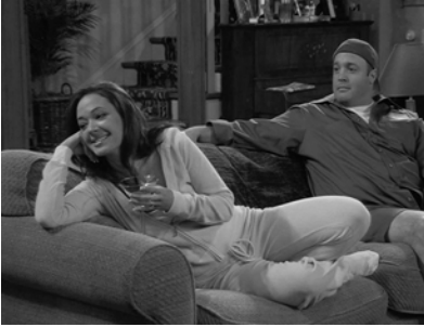
Abb. 30: KING OF QUEENS, Konsum und Manipulation

Auf diese Weise werden unterschiedliche, für unsere Lebensformen sehr wichtige Fragen erläutert. Es geht in KING OF QUEENS beispielsweise häufig darum, dass Handeln in der Beziehung immer stärker ökonomisch bestimmt erscheint, vielleicht weil wir in unserer neoliberalen Kultur davon bedroht sind, nur noch Konsumenten unseres Lebens zu sein. Das bezieht sich auf eine falsche Form der Gegenseitigkeit, die immer für das, was gegeben wird, etwas Entsprechendes zurückfordert. Die Wiederverheiratungskomödien leiten uns vor allem dazu an, wie Cavell feststellt, aus diesem Zirkel der Vergeltung oder auch der gegenseitigen Vergütung auszubre-