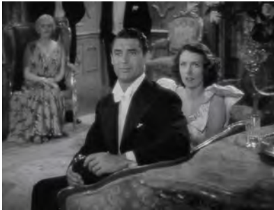
Abb. 8 und 9: THE AWFUL TRUTH, Lucy spielt für Jerry

begegnen. Irene Dunne führt als Lucy am Ende dem von Cary Grant gespielten Ex-Mann die Parodie der Nummer einer Nachtclubsängerin vor, die zu Beginn des Films zu sehen war, während Grant für sie unfreiwillige und freiwillige kleine Stummfilmgrotesken oder Filmparodien vorführt, indem er etwa von einem Stuhl fällt oder vor ihr und ihrem neuen Verehrer ein Melodrama ihrer gescheiterten Ehe vorspielt (scheinbar um sie vor Verdächtigungen zu schützen). Dieses Spiel füreinander ist auch in dem kindlichen Spiel von Cary Grant und Katharine Hepburn in BRINGING UP BABY zu finden. 477 Durch diese angedeuteten Formen der Selbstreflexivität unterrichtet der Film uns darüber, wie wir zu ihm Stellung beziehen sollen und wie er zu sich selbst Stellung bezieht: