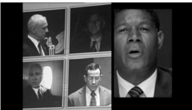
Abb. 34: 24, Palmer und Shakespeare

sante Weise ein Licht darauf, wie die Erzählbedingung eine Figur einschließt und ihr erst dann Raum gibt, wenn sie diese Bedingung überzeugend zu überschreiten versteht. Die Grenzen David Palmers sind zugleich die Grenzen eines Formats, das gerade deswegen überzeugt, weil es eine überzeugende, ästhetische Geschlossenheit vorführt, eine in jeder einzelnen Einstellung mehr oder weniger befriedigende Bildfülle. Aber es gibt einen Preis, der dafür gezahlt werden muss. Er hat viel mit der bereits erwähnten