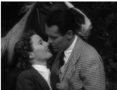
Abb.7: THE LADY EVE, Romantische Szene mit Pferd

in being asked to witness this awful exposure« (ebd., 61). Scham als Indiz für die Beteiligung des Betrachters bedeutet, dass wir nicht nur über andere lachen oder sie lächerlich finden, sondern dass wir uns über uns selbst wundern oder uns mit uns selbst beschäftigen. Die eklatante Unfähigkeit der männlichen Hauptfigur, Menschen zu erkennen, fällt auf uns selbst zurück. Cavell versucht in den Lesarten der Komödien immer wieder zu betonen, dass sich der Zuschauer nicht in einem erhabenen Status des Mehr-Wissens befindet. Stattdessen sucht er auf der Ebene des Films Momente, in denen die Figuren nicht wissen, was sie tun, Missverständnissen unterliegen und in denen die Komik daher rührt, dass es eine Spannung zwischen dem