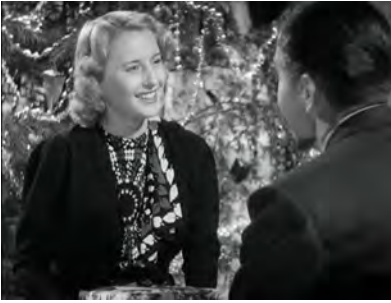
Abb. 21: STELLA DALLAS, Stellas Wissen über Kleidung

struktion, um Stella Dallas' überaus komplexen, gekonnten Umgang mit Zeichen zu beschreiben und deutlich zu machen, dass sie bewusst mit ihrer Selbstpräsentation umgeht.