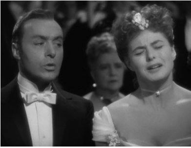
Abb.2: GASLIGHT, My pleasure is gone

vells vor: die Auseinandersetzung damit, was an Filmen unterhält, und die Erforschung der Natur unseres Interesses für Filme, die uns unterhalten und bewegen. Cavell weist immer wieder darauf hin, dass wir, um dieses Interesse erkunden zu können, uns mit uns selbst beschäftigen müssen und nicht immer zulassen dürfen, dass etwas den Blick auf unser Vergnügen verstellt. Man könnte sagen, dass Theorie oder unsere ›Probleme‹ mit der Populärkultur unseren Blick auf dieses Vergnügen auf ähnliche Weise verstellen wie Gregorys Manipulationsversuche.