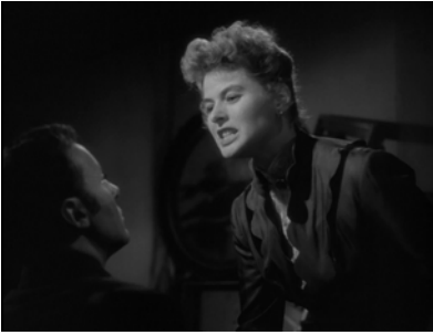
Abb. 15: GASLIGHT, Arie der Rache und des Wahnsinns

»verrückten«, weil versetzten Existenz. In einem überaus melodramatischen Monolog, der auf den Dagger-Monolog aus »Macbeth« anspielt, wendet sie den von ihrem Mann durch Manipulationen suggerierten Wahnsinn gegen ihn. Sie wird auf theatralische Weise sichtbar, bezahlt aber den Preis für die Herstellung ihrer Existenz mit dem Akzeptieren des eigenen Wahnsinns, der dem Wahnsinn der Existenz oder der Gesellschaft Rechnung trägt (ebd., 60).