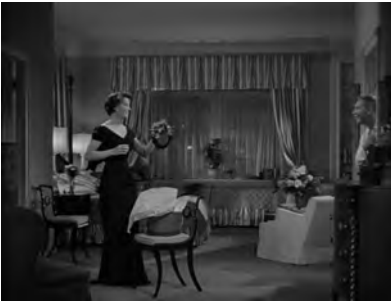
Abb.6: ADAM'S RIB, Schlafzimmer als Bühne

Anfang an die Privatheit und Intimität ihrer Beziehung bedroht (ebd., 192). Wie in »The World Viewed« beschrieben gibt Film also damit einer seiner Möglichkeiten, Betrachter an Welt zu beteiligen und ihre Privatheit (ihren Status als Betrachter) nicht in Frage zu stellen, Bedeutung, was heißt, dass es ein Teil der Inszenierung ist, dieser Tatsache einer ambivalenten Öffentlichkeit gerecht zu werden und dass die Figuren die Bedingung, betrachtet zu werden, bereits auf der Ebene der Erzählung erfahren müssen. ◀65