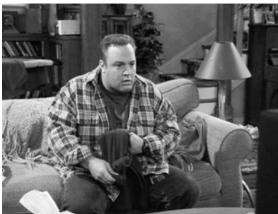
Abb. 29: KING OF QUEENS, Doug als Betrachter einer Soap Opera

der Unterscheidung, das die Warenform Unterhaltungskunst in Zirkulation hält, sondern diese Selbstreflexivität versteht es wirklich, uns Erkenntnisse über unseren Status als Zuschauer vorzuführen. Das lässt sich schlecht am Material selbst beweisen, aber an den Anschlussphänomenen: Diese Szene ermutigt zu Interpretationen, sie erträgt es, immer wieder vorgeführt und angeschaut zu werden. Sie hat bis jetzt für mich und viele andere nichts von ihrer verblüffenden Unterhaltsamkeit verloren. Dies ist einer der Momente, die das Kriterium einer nachhal-